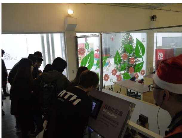
時間：107/12/4 地點：林口光滄金工藝術館 活動名稱：企業參訪體驗活動