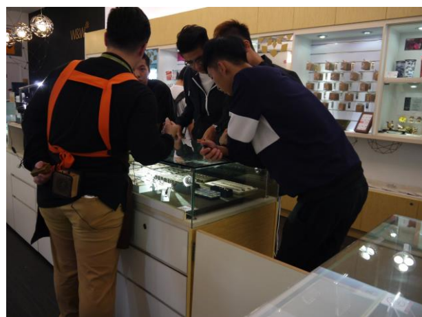
時間：107/12/4 地點：林口光滄金工藝術館 活動名稱：企業參訪體驗活動