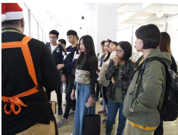
時間：107/12/4 地點：林口光滄金工藝術館 活動名稱：企業參訪體驗活動