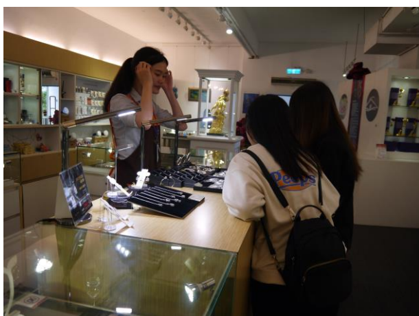
時間：107/12/4 地點：林口光滄金工藝術館 活動名稱：企業參訪體驗活動