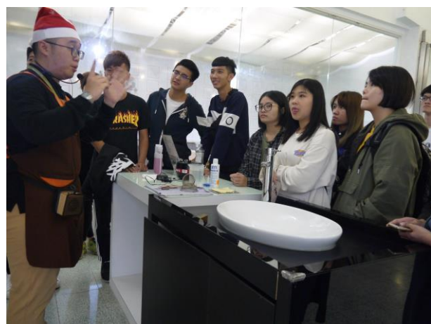
時間：107/12/4 地點：林口光滄金工藝術館 活動名稱：企業參訪體驗活動