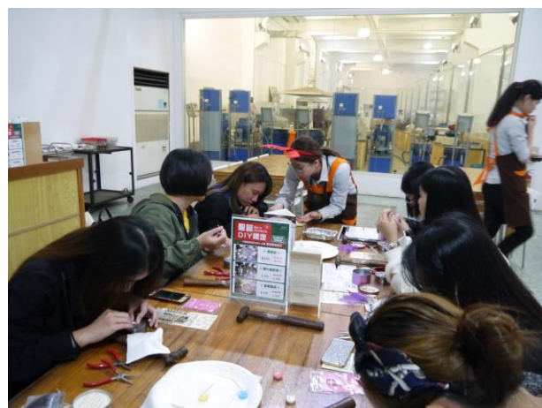
時間：107/12/4 地點：林口光滄金工藝術館 活動名稱：企業參訪體驗活動