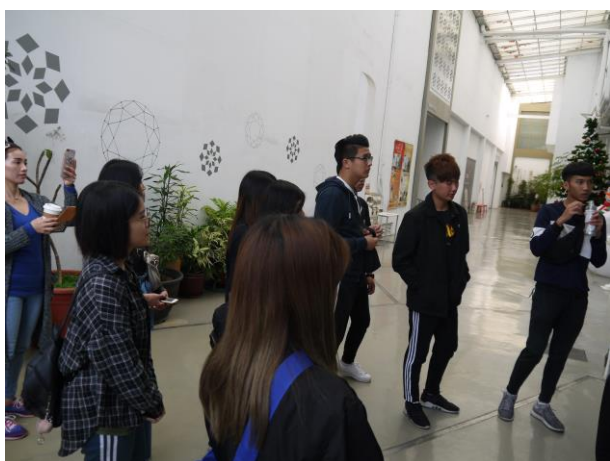
時間：107/12/4 地點：林口光滄金工藝術館 活動名稱：企業參訪體驗活動