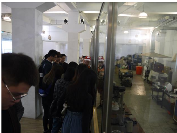
時間：107/12/4 地點：林口光滄金工藝術館 活動名稱：企業參訪體驗活動