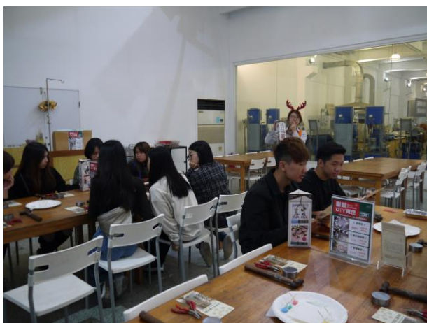
時間：107/12/4 地點：林口光滄金工藝術館 活動名稱：企業參訪體驗活動