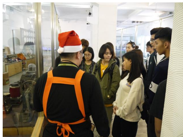
時間：107/12/4 地點：林口光滄金工藝術館 活動名稱：企業參訪體驗活動