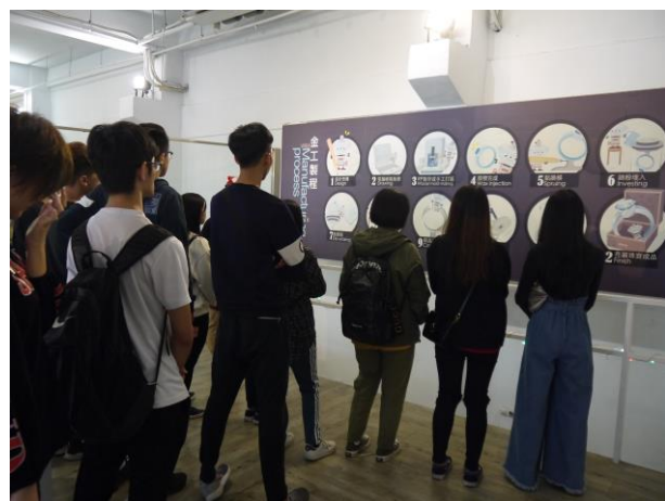
時間：107/12/4 地點：林口光滄金工藝術館 活動名稱：企業參訪體驗活動